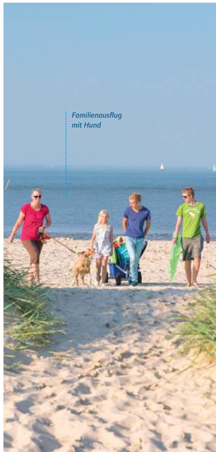
Familienausflug mit Hund

Liebe Hundehalterin, lieber Hundehalter, herzlich willkommen in Ihrem Wangerland-Urlaub mit Hund. Für ebenso abwechslungsreiche wie harmonische Ferientage mit Ihrem Vierbeiner haben wir Ihnen in diesem Flyer Tipps und Informationen sowie einige Hinweise und Ratschläge zum rücksichtsvollen Verhalten mit Hund zusammengestellt.